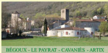
BÉGOUX - LE PAYRAT - CAVANIÈS - ARTIX

Une réunion publique se tiendra le 29 novembre 2022 , à 18 h 30, à la salle des fêtes de Bégoux avec à l'ordre du jour quatre sujets :